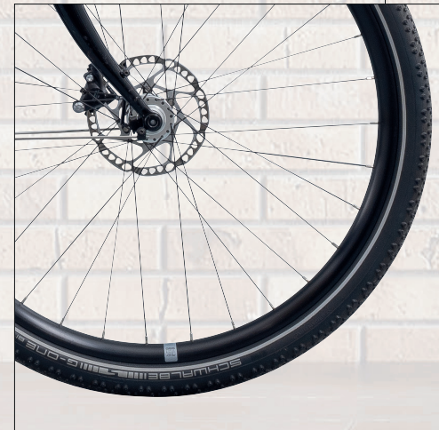
Schwalbe G-One Bite Performance