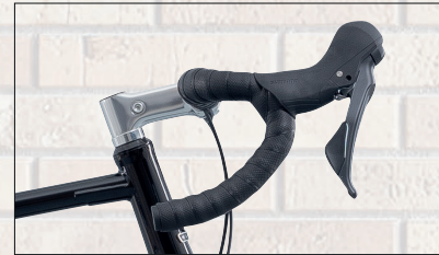
GRX STI & Brooks Bar Tape