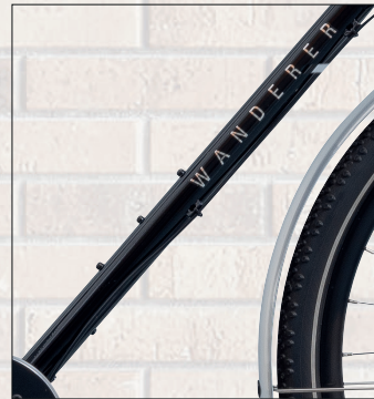
Handmade Steel Frame with the Reynolds 520 tubes