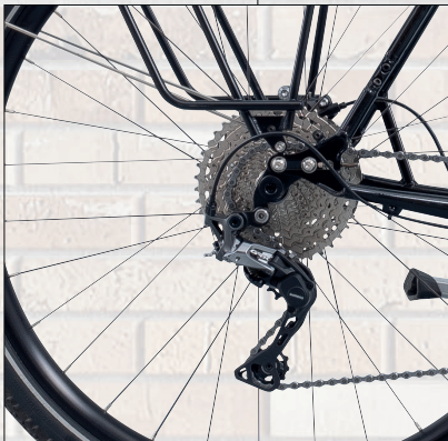
11-speed Shimano GRX